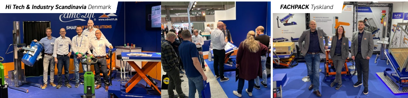
Hi Tech & Industry Scandinavia Denmark