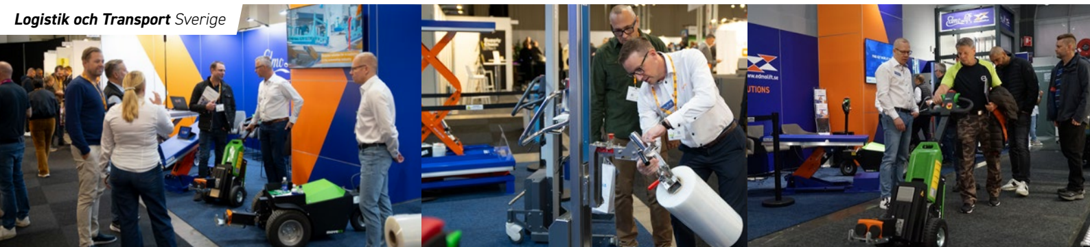
Logistik och Transport Sverige