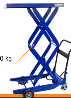
CZ 203 Kapacitet 200 kg

Med en fremstillingstid på tre dage på C-serien, tager EdmoLift et skridt i retning af sin ambition om at tilbyde tilgængelige, fleksible og smarte løfteløsninger, hvilket i sidste ende skaber en konkurrencemæssig fordel for alle parter.